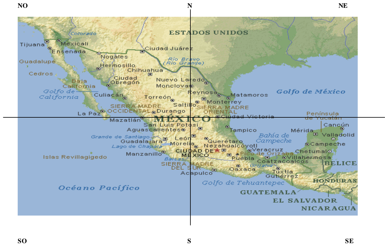
Mapa 1. México y sus fronteras.