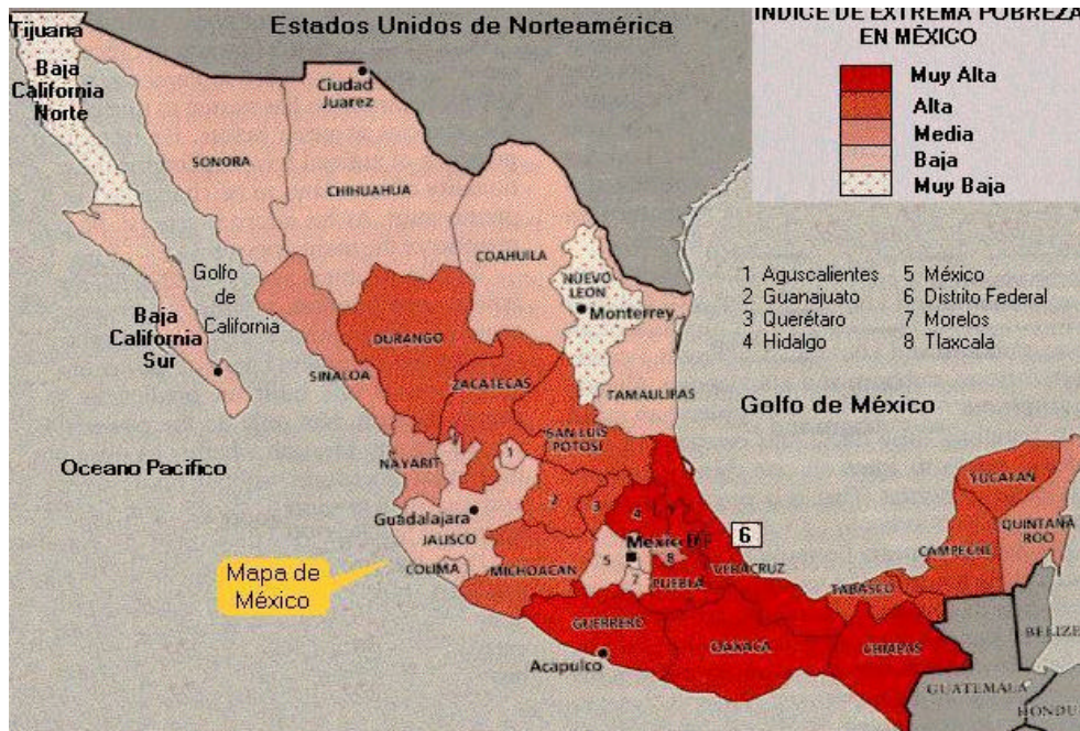
Mapa 10. Índices de pobreza