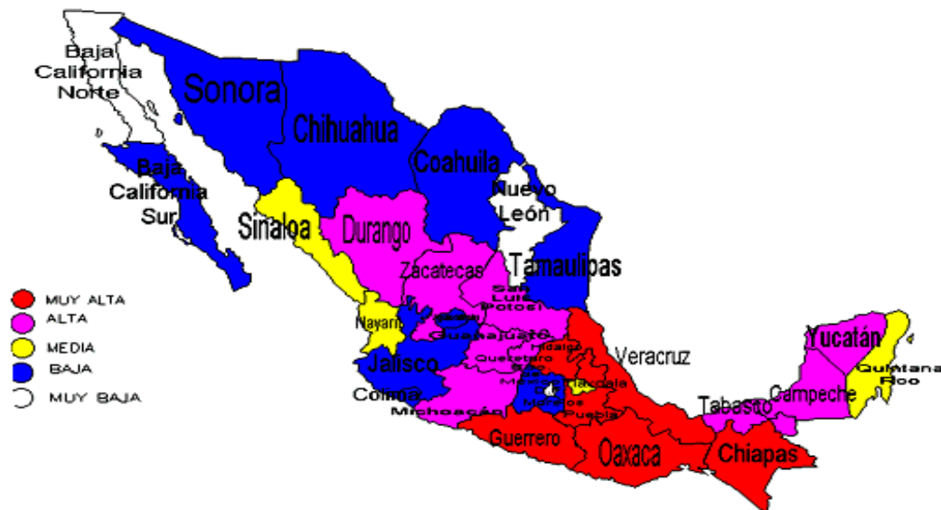
Mapa 9. Marginalidad en México.